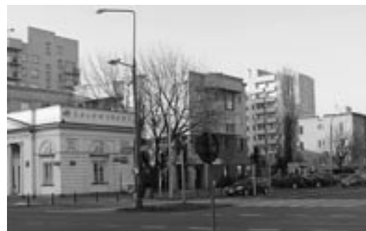
Zmodernizowana willa Geberów przy ul. Lubelskiej 13 (pierwsza kamienica od prawej), miejsce posiadłości rodziny – za Grochowską Rogatką w głębi osiedle mieszkaniowe Skaryszewska-Lubelska

Po transformacji ustrojowej w 1990 roku majątek Pralnio-Farbiarni „C. Gebera” miasto przekazało nieodpłatnie Spółdzielni Mieszkaniowej „PAX”, która w wyniku ugody ze spadkobiercami przekazała im cztery mieszkania w jednym z bloków osiedla Skaryszewska-Lubelska wybudowanego w sąsiedztwie dawnej posiadłości Geberów.