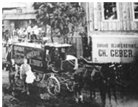
Zdjęcie reprodukcji fotografii nieznanego autora z ok. 1900 r. Pralnia i farbiarnia „Ch. Geber”