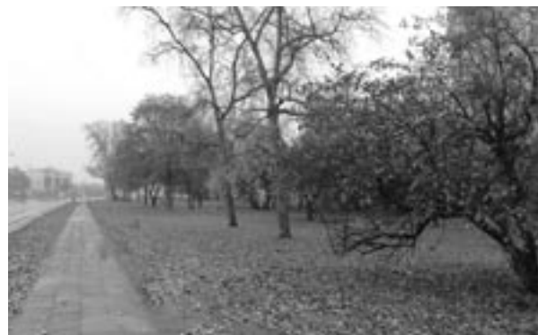
Teren dawnej garbarni.