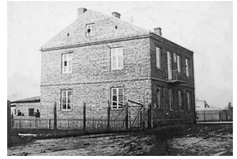
Siedziba przy Młądzkiej – w latach trzydziestych