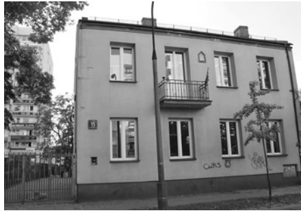
Siedziba firmy przy Młądzkiej – dzisiaj

Po śmierci Zygmunta Kamińskiego prowadzenie pracowni przejęli synowie Zygmunt Włady-