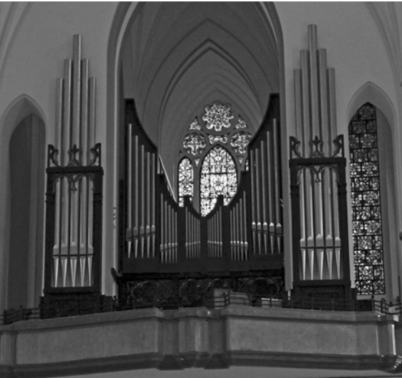
Organy w kościele Najczystszego Serca Maryi na Grochowie