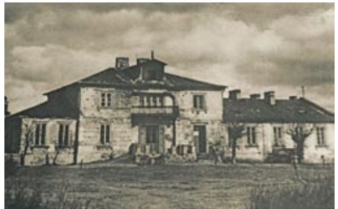
Dworek Myślińskich

W 1916 roku rozpoczęło swoją działalność Towarzystwo Przyjaciół Grochowa, w którego działaniach ważną rolę odegrały dążenia ideowe, patriotyczne, szacunek do przeszłości Grochowa, zabytków i pamiątek – wartości, które przez dziesiątki lat tłumione przez zaborcę odżyły w sercach mieszkańców. Towarzystwo rozpoczęło pracę nad podniesieniem kulturalnego, zdrowotnego i gospodarczego poziomu grochowian. Działacze społeczni poszukujący miejsca na swoją siedzibę wynajęli pomieszczenia dworu z zamiarem sfinansowania remontu i adaptacji pomieszczeń dla potrzeb utworzenia czytelnicy publicznej i sal wykładowych. Jedną z ważniejszych inicjatyw było utworzenie teatru amatorskiego i organizacja przedstawień patriotycznych, które odbywały się w wynajętej sali dworu. Niestety intencje remontu dworskich pomieszczeń na potrzeby kulturalno-oświatowe nie zostały spełnione, bowiem Zarząd Towarzystwa podjął decyzję o budowie Domu Oświaty i Kultury na podarowanym placu na rogu Grochowskiej i Nasielskiej. Niestety i ten zamiar działaczy społecznych również upadł.