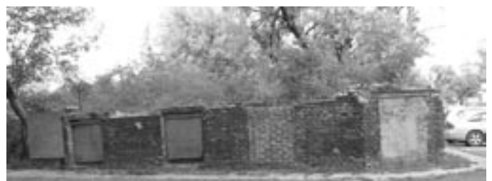
Pozostałość po domu z czerwonej cegły.