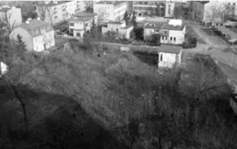
Teren po wyburzeniu Spółdzielni Inwalidów. Po lewej stronie widoczny dom, który sąsiadował z siedzibą kibucu.

Osiedle Spółdzielni Mieszkaniowej Ostrobramska to jedno z wielu osiedli powstałych w latach 70. na Grochowie. Część osiedla w rejonie ulic Witołińskiej, Łukowskiej i Grochowskiej to grunty z nieuregulowanym statusem własnościowym. Na tej części wzdłuż ulicy Grochowskiej znajdowały się zniszczone po wojnie budynki fabryczne z mieszkalną przybudówką objęte działaniem dekretu Bieruta. W stosunku do tej nieruchomości toczą się postępowania administracyjne wszczęte przez byłych właścicieli.