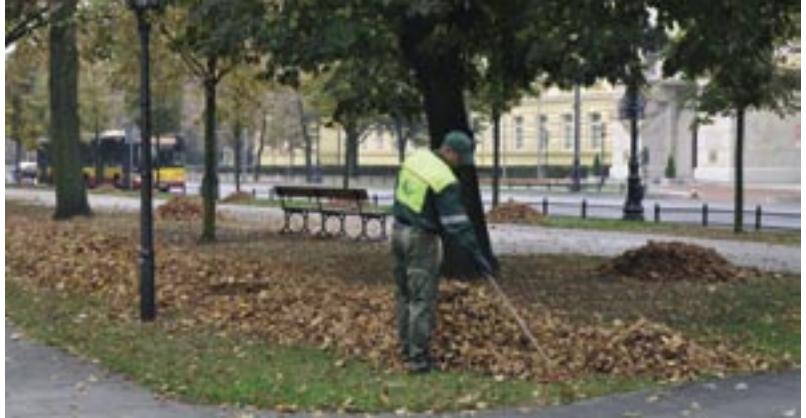
Grabienie liści potwać może nawet do końca listopada.