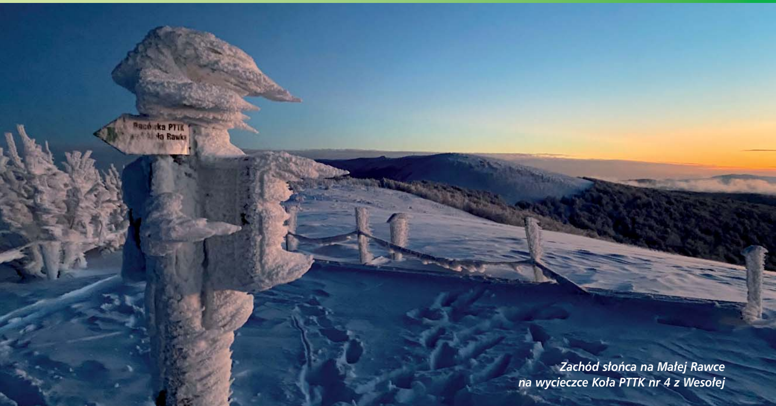
Zachód słońca na Małej Rawce na wycieczce Koła PTTK nr 4 z Wesołej