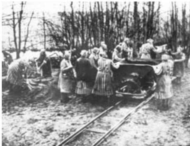
Więźniarki obozu KL Ravensbrück przy ciężkiej pracy budowlanej.