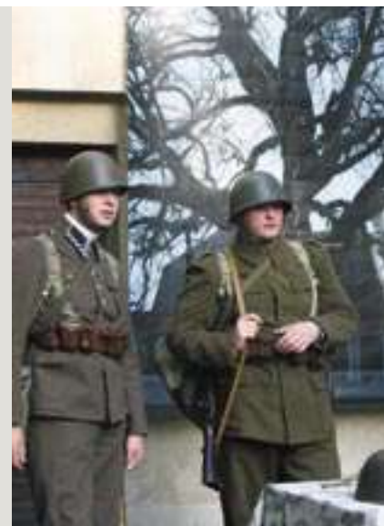
Rekonstruktorzy podczas 73. Rocznicy obrony Saskiej Kępy, fot. Zofia Domaniewska (KOS), 2012 oraz fot. Piotr Chudy (KOS), 2012.