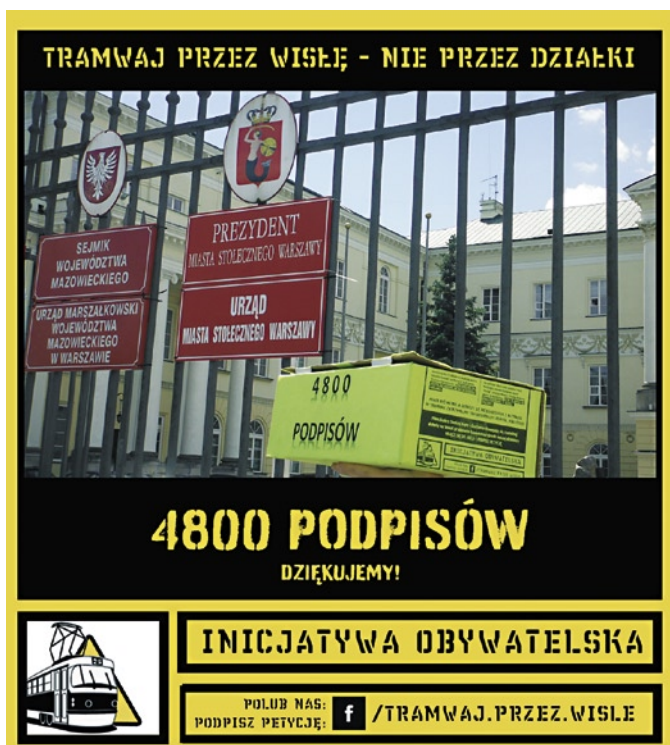
Grafika Inicjatywy Obywatelskiej „Tramwaj przez Wisłę – nie przez działki”

Inicjatywa obywatelska „Tramwaj przez Wisłę – nie przez działki” prężnie działała również podczas wakacji. 20 lipca br. jej członkowie złożyli do ratusza petycję ws. zmiany przebiegu planowanej linii tramwajowej na Goław. Wniosek dot. przebiegu planowanej trasy, tak aby nie prowadziła przez tereny Kanału Wystawowego, podpisało 4800 osób. Inicjatorzy w petycji sami podają alternatywne rozwiązania.