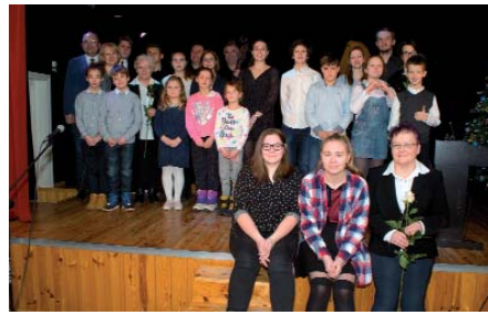
Wspólne kolędownie w DK Rembertów

W dniach 11–12 lutego 2019 r. odbędą się Dni Tańca w Domu Kultury „Rembertów”. Będzie można zapoznać się z instruktorami i wziąć udział