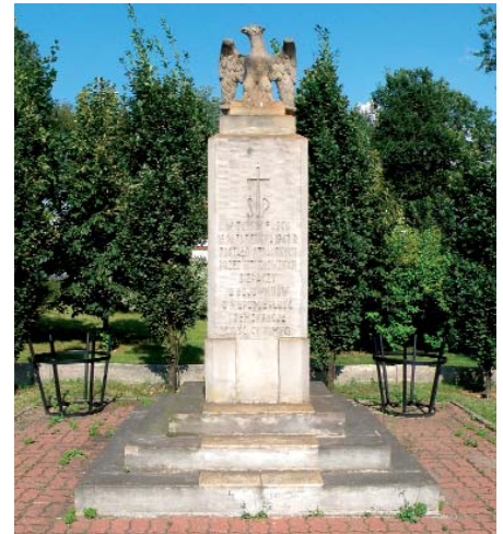
Pomnik powieszonych w Rembertowie z neutralnym napisem

Po wojnie ofiary ekshumowano z tymczasowych mogił w rejonie getta i pochowano