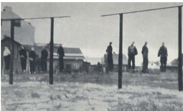
Szubienice w Rembertowie rano 16 października 1942 r.

Mamy już jesień – inaczej wygląda świat, dni ustępują miejsca długim szarym wieczorom i późnym porankom. 74 lata temu, 16 października 1942 roku mieszkańcy Warszawy mieli w taki poranek koszarne przeżycie. W pięciu miejscach stolicy przy torach kolejowych stało 5 par szubienic. Wisiało tam pięćdziesięciu mężczyzn przywiezionych i zamordowanych przed schyłkiem nocy. W Rembertowie przy rogu ulic Piłsudskiego i Żwirki (dziś Chruściela i Cyrulików) dokonano jednej z egzekucji.