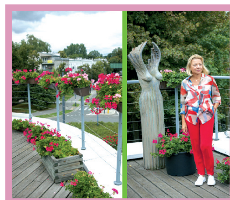
Prom Kultury Saska Kępa , kategoria: Budynek i tereny ogólnodostępne