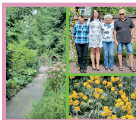
Oddział Dnienny Psychiatryczny Samodzielnego Zespołu Publicznych Zakładów Lecznictwa Otwartego , kategoria: Inne formy zieleni miejskiej