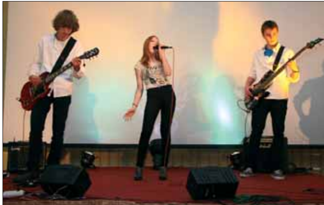
Zespół REDHEAD z Gimnazjum 119 w Warszawie – laureaci I miejsca

Przesłuchania w tegorocznej edycji odbyły się w dniach 26–27 listopada w Sali konferencyjnej Hotelu Boss.