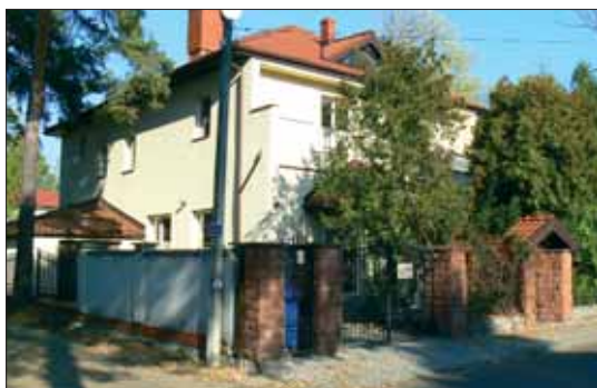
Dom Lotta po remoncie