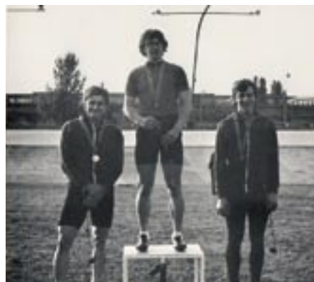
Dekoracja mistrzów ORZEŁA

W znacznej części środki finansowe przeznaczone na cele działalności sportowo-rekreacyjnej przyznawane były w minionych latach przez Zarząd Dzielnicy, po uprzednim uzyskaniu opinii komisji społecznej i ogłoszeniu konkursu. Ze względu na zaległości finansowe Klubu w stosunku do Miasta, jak i toczące się postępowanie prawne o status własnościowy obiektu, decyzją Biura Sportu i Rekreacji Klub czasowo został wyłączony z możliwości uzyskiwania dotacji celowych. Dalsze finansowanie uzależnione zostało od ustalenia właściciela terenów lub gospodarza obiektów. Od finansowania remontu toru kolarskiego odstąpił