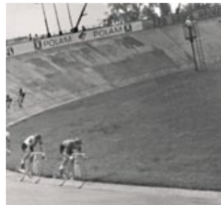
Kolarze na torze, lata 70, zdjęcie z kolekcji Mirosława Jurka

Tak jak do tej pory kontynuować będziemy szereg wykładów o różnorodnej tematyce z zakresu historii, sztuki, geografii czy zdrowia. Już 20.09 o godz. 12.00 zapraszamy na wykład: „5 sposobów, jak cofnąć choroby autoimmunologiczne i stany zapalne w organizmie”. To spotkanie inauguracyjne cyklu warsztatów w ramach programu „Świadome odżywianie”. Dzięki zdobytej wiedzy łatwiej zmienimy przyzwyczajenia żywieniowe i będziemy wiedzieli, jak korzystać z życia, żeby nie trzeba