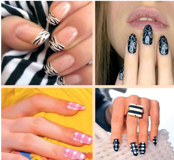
Malowanie paznokci przybiera obecnie bardziej artystyczną formę

Paznokcie u nóg obcinamy nożyczkami lub cążkami, skracając je w linii prostej bez zaokrąglania na brzegach. Zbyt głębokie wycinanie paznokci po bokach może spowodować tzw. wrastanie paznokcia. Skrócone pa-