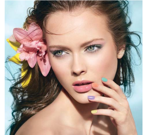
Tej wiosny kobiety bardzo chętnie sięgają po pastele

Ładnie pomalowane paznokcie mogą być bardzo efektowne, ale kolor i deseń należy dostosować do charakteru pracy i otoczenia. Kolorowy lakier oraz wszelkiego rodzaju eks-