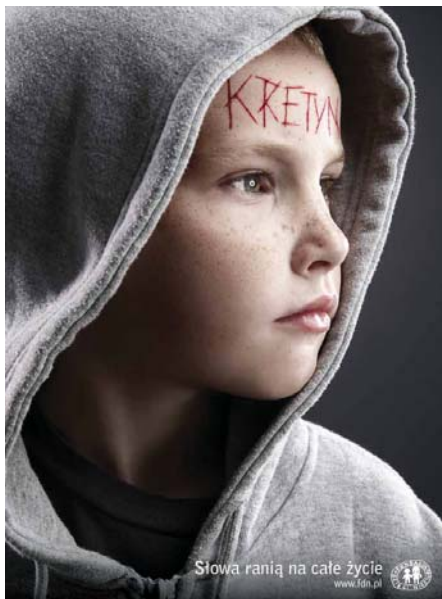
Kampania „Słowa ranią na całe życie” podejmująca temat krzywdzenia emocjonalnego dzieci