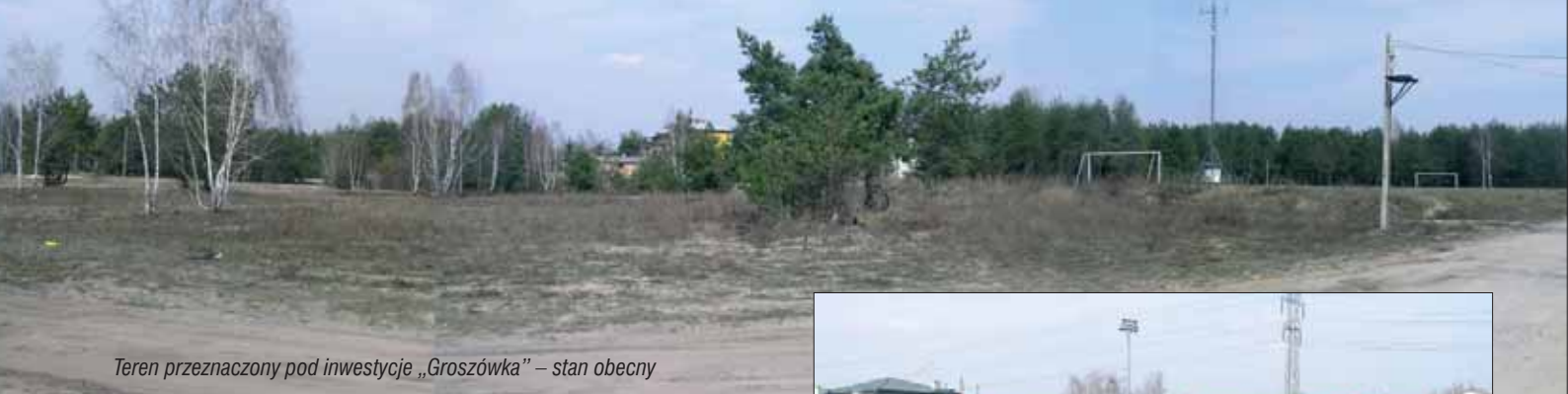
Teren przeznaczony pod inwestycje „Groszówka” – stan obecny