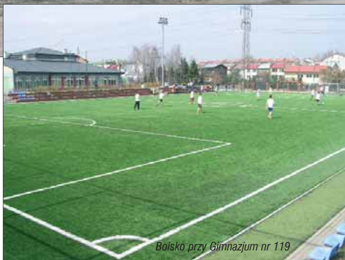
Boisko przy Gimnazjum nr 119

Oto obszerny fragment tego wniosku: „W Dzielnicy Wesola m. st. Warszawy znajduje się teren przeznaczony pod inwestycje sportowo – rekreacyjne, których właścicielem jest Miasto Stołeczne Warszawa. Teren (...) położony jest na osiedlu Groszówka, ograniczony ulicami, Narutowicza, Mickiewicza, Słowackiego, Matejki. Obecnie jest niezabudowany. Działka