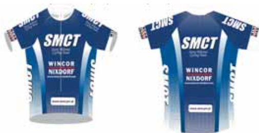
Oto nasze klubowe stroje, w których będziemy startować w sezonie 2006.

działaniach (relacje, spotkania, treningi, zdjęcia, plany) znajdziecie Państwo na stronie www.smct.prv.pl , do której odwiedzania serdecznie zapraszam.