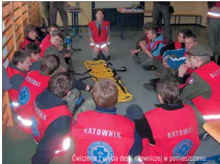
Ćwiczenia z użycia deski ratowniczej w pomieszczeniu...

durami działań przy różnego rodzaju akcjach i obstawach oraz ćwiczyli współdziałanie podczas zajęć team-buildingowych.