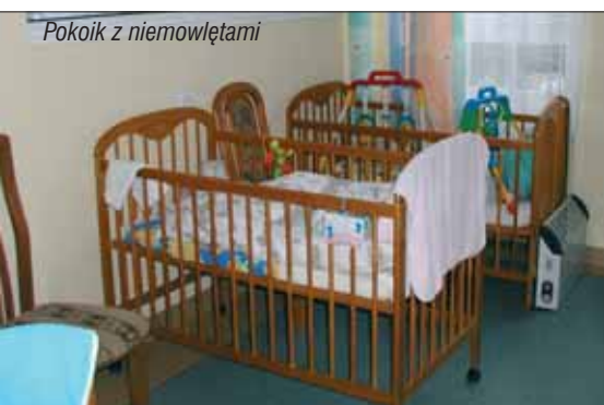
Pokoik z niemowlętami

Przez cały grudzień Stowarzyszenie Sądzkie prowadziło zbiórkę darów dla niemowlaków z interwencyjnego Pogotowia Opiekuńczego w Otwocku. To dzieci porzucone przez matki zaraz po porodzie lub odebrane rodzicom po interwencji policji.