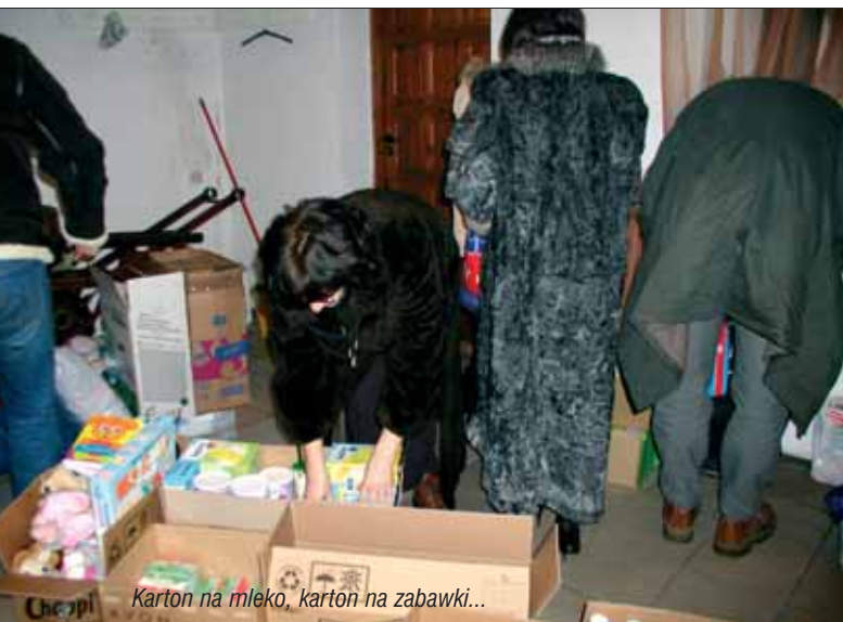
Karton na mleko, karton na zabawki...

Przez cały grudzień Stowarzyszenie Sądzkie prowadziło zbiórkę darów dla niemowlaków z interwencyjnego Pogotowia Opiekuńczego w Otwocku. To dzieci porzucone przez matki zaraz po porodzie lub odebrane rodzicom po interwencji policji.