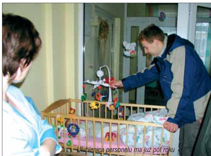
Ulubienica personelu ma już pół roku