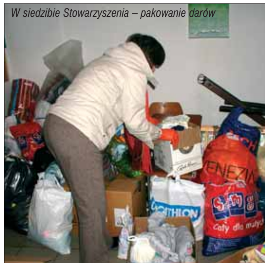
W siedzibie Stowarzyszenia – pakowanie darów

Za naszym pośrednictwem Dyrekcja i Personel Interwencyjnego Pogotowia Opiekuńczego składają Państwu serdeczne podziękowania.