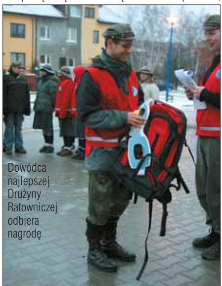
Dowódca najlepszej Drużyny Ratowniczej odbiera nagrodę

Zasadnicza część manewrów rozpoczęła się jednak w sobotę. O 8 00 rano do bazy dotarły patrole HOPR i rozpoczęła się właściwa część ćwiczeń. Apel o 8 30 ,