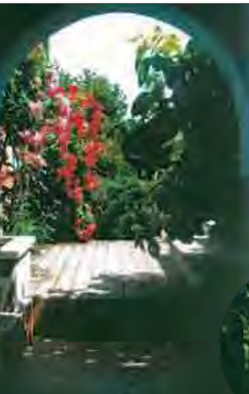
fot. 2 Takie ogrodowe obrazy: piękne róże pnące, można zobaczyć latem przy ul. Wiązów 4

Na ul. Wiązów 4 (fot. 2-6) ogród jest już „dojrzały”, zakładany był