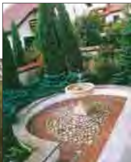
fot. 4 Każde miejsce tego ogrodu jest dokładnie zaplanowane – we wnęce znalazła swe miejsce niewielka kamienna fontanna.