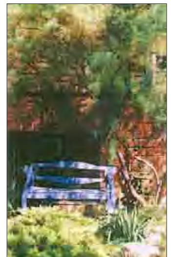
fot. 9 P. Ania tworzy uroczego miejsca do odpoczynku tu: „niebieska ławeczka” pod tamaryszkiem.

Ula Wróblewska ARTIS. Architektura krajobrazu artis@w.pl