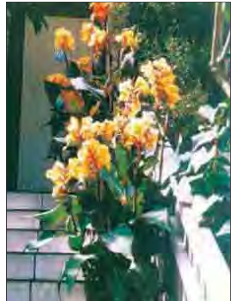
fot. 1 Pięknie kwitnące, olbrzymie Canny w ogrodzie p. Partyka