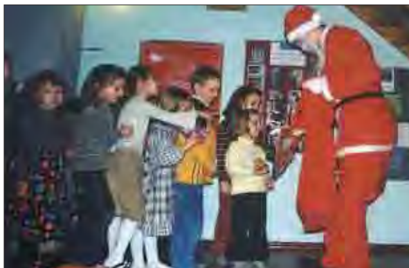
Kolejka do Mikołaja po paczki pełne niezapodziańek

Zajęcia prowadzone będą od godz. 9 00 do 15 00 (Istnieje możliwość indywidualnego przedłużenia godzin opieki nad dzieckiem). Wszystkie materiały, soki, owoce i słodycze dzieci otrzymują od Fundacji – jedyne co muszą same przynieść to drugie śniadanie i koniecznie kaptcie na zmianę.