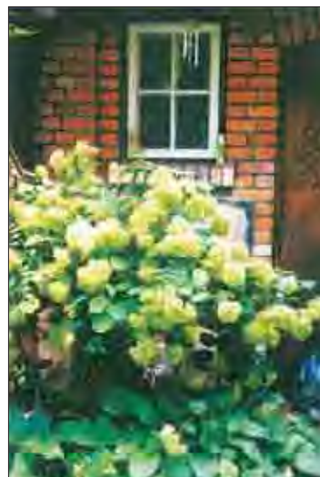
fot. 7 Pięknie kwitnąca hortensja posadzona funkcją, rośliny które świetnie radzą sobie w zacienionym miejscu.