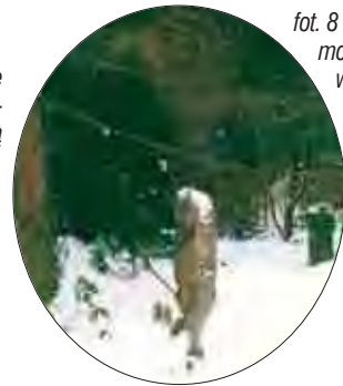
fot. 8 Nawet zimą ogród może wyglądać ciekawie zwłaszcza jeśli znajdzie się w nim miejsce na taką rzeźbę!

z rozmachem ok. 8 lat temu. Starannie dobrana architektura ogrodowa i rozrośnięte drzewa i krzewy tworzą zgrabną całość. Letnią dominantę i prawdziwą ozdobę ogrodu stanowią róże, szczególnie obficie kwitnące róże pnące.