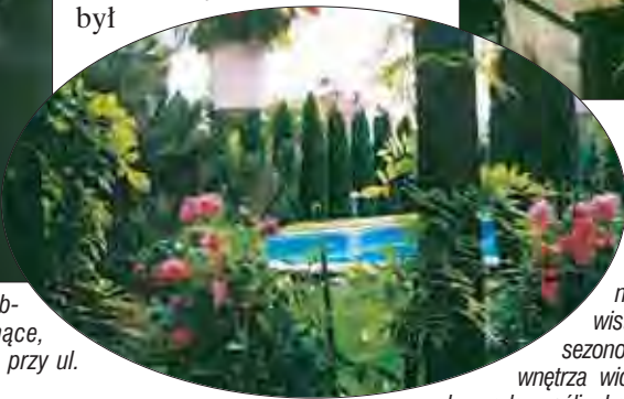
fot. 3 Eleganckie ogrodowe podłogowe z głową lwa. fot. 6 Po drewnianej pergoli wiję się wisteria, otaczają ją sezonowe kwiaty a z jej wnętrza widać osłonięty kolumnadą z roślin, basen.