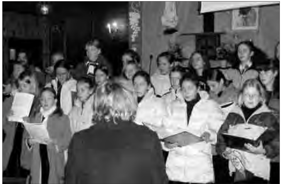
Il canto z taką samą radością występuje w renomowanych salach koncertowych, jak i dla najbliższych – koncert w naszym drewnianym kościełku.

Dodatkowo obok sukcesu artystycznego niezauważenie postępuje budowanie czegoś bardzo trwałego i bardzo pięknego. Il canto staje się wspólnotą.