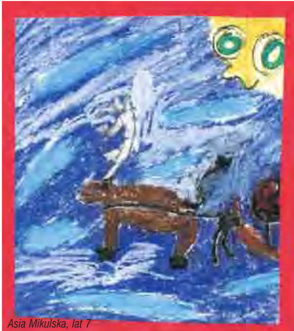
Asia Mikulska, lat 7