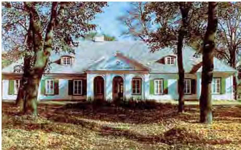
Dworek w Sucheju – przykład zachowanego dworu polskiego

wością właściwą artyście, grosza większego nie posiada i – z takimi cechami i przy obecnych realiach – posiadać pewnie nie będzie. Sprzedać ojcowizny nie chce. Zrobił skromniutki remont, pozwalający mieszkać choć podczas urlopu. Z iście szlacheckim uporem odchwaszcza i pielęgnuje park. Park cudowny z pięknymi alejami i zakątkami