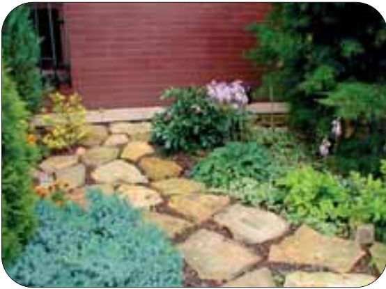
fot.6 Jasne akcenty bylin współgrają ze ścieżkami ogrodowymi z piaskowca.