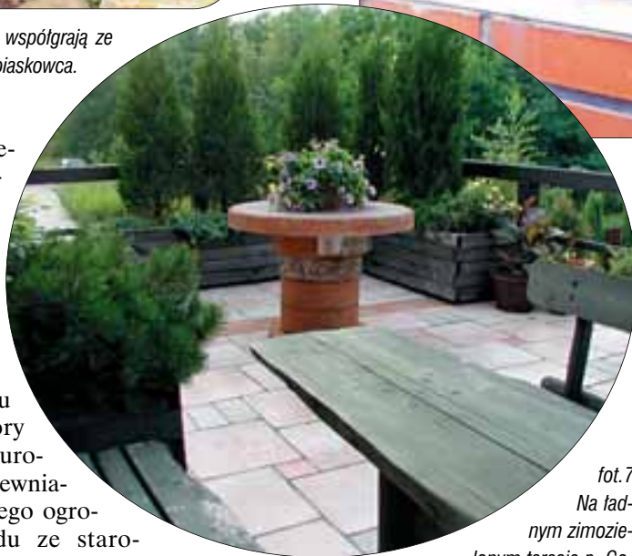
fot.7 Na ładnym zimozielonym tarasie p. Goschorskich uwagę zwraca oryginalny kwitnący stolik.

Od strony ul. Ciemplarnianej 43 można zobaczyć zimozielony taras p. Goschorskich (fot. 7), który wyróżniliśmy w naszym konkursie. Jego wnętrze urządzone jest w stylu rustykalnym, który pasuje do całości uroczego domu z drewnianych bali i zadbanego ogrodu ze starodrzewem (fot. 8).