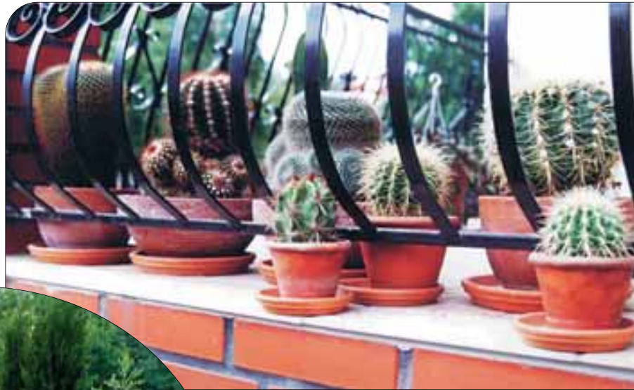
fot.9 Te kaktusy p. Wiesiołek hodują od czasów studiów, gdy jest słoneczne lato pięknie kwitną.

Od strony ul. Ciemplarnianej 43 można zobaczyć zimozielony taras p. Goschorskich (fot. 7), który wyróżniliśmy w naszym konkursie. Jego wnętrze urządzone jest w stylu rustykalnym, który pasuje do całości uroczego domu z drewnianych bali i zadbanego ogrodu ze starodrzewem (fot. 8).