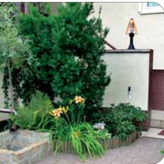
fot.1 Na ciemnym tle cisa ładnie kontrastują ciepłe kolory kwiatów liliowca i jasny fiolet funkii.