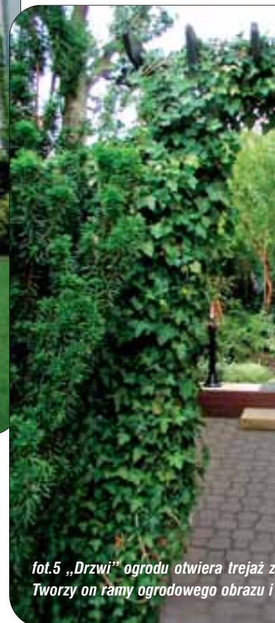
fot.5 „Drzwi” ogrodu otwiera trejaż z bluszczem. Tworzy on ramy ogrodowego obrazu i