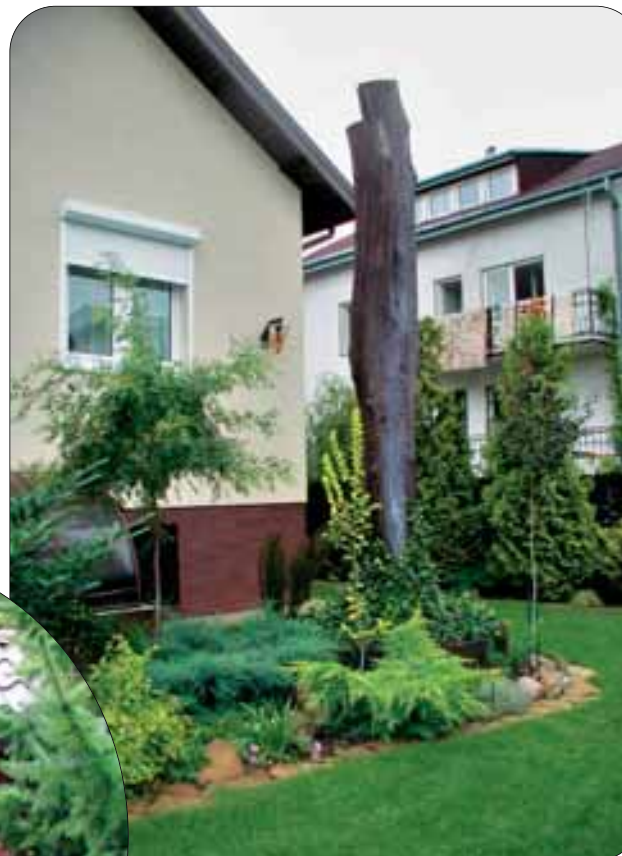
fot.4 Oryginalną rabatę w „sercu” ogrodu podkreśla stary pień który służy tu za element dekoracyjny – po nim zaczęły się wspinać bluszcz.