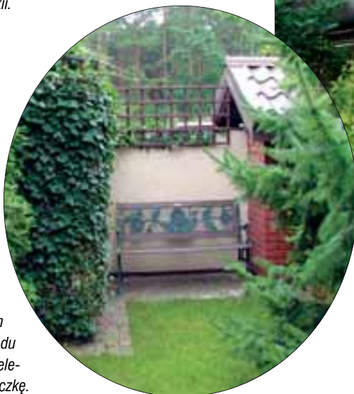
fot.2 Każdy szczegół na swoim miejscu: w spokojnym zakątku ogrodu postawiono elegancką ławeczkę.