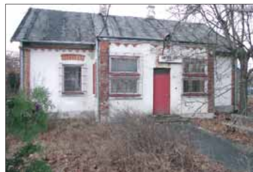
Zdjęcie ul. 1 Praskiego Pułku 8 – stan obecny.

Z inicjatywy Zarządu Dzielnicy Wesola w ubiegłym roku rozpoczęto negocjacje zmierzające do wydzierżawienia opisanej nieruchomości. Dziś trwają już prace projektowo-kosztorysowe odnośnie remontu budynku z przeznaczeniem na poradnię. Rozpoczęto również procedurę legislacyjną zmierzającą do powołania w tym miejscu nowej poradni psychologiczno-pedagogicznej.