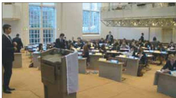
Widok na salę parlamentu

W spotkaniu brało udział 165 osób z 30 delegacji podzielonych na 10 komitetów po 15 osób zajmujących się różnymi zagadnieniami. Reprezentacja z Polski liczyła 5 członków: Marlena