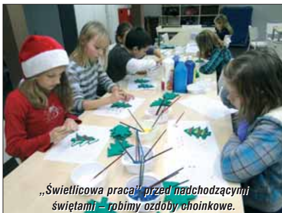
„Świetlicowa praca” przed nadchodzącymi świątami – robimy ozdoby choinkowe.

Wszystkie treści zajęć świetlicowych są skorelowane z programem nauczania, co powoduje jego