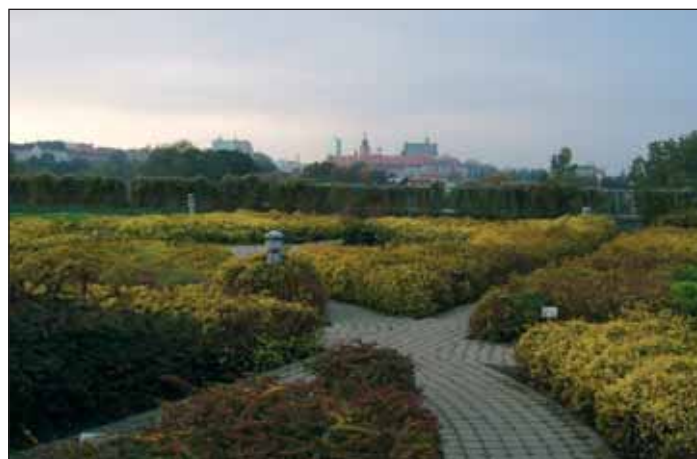
Ogród złoty z widokiem na Stare Miasto (Sierańska 2007)

od 1 maja do 30 września), 9.00–18.00 (1–30 kwietnia oraz 1–31 października) 9.00–15.00 (1 listopada–31 marca, bez wstępu na dach). Znajduje się na rogu ulic Dobrej i Lipowej, na Powiślu. Dojazd autobusami 118, 150, 506, E-6 (przystanek „Biblioteka Uniwersytecka”). Wejście gratis. Więcej informacji na stronie internetowej www.buw.uw.edu.pl .