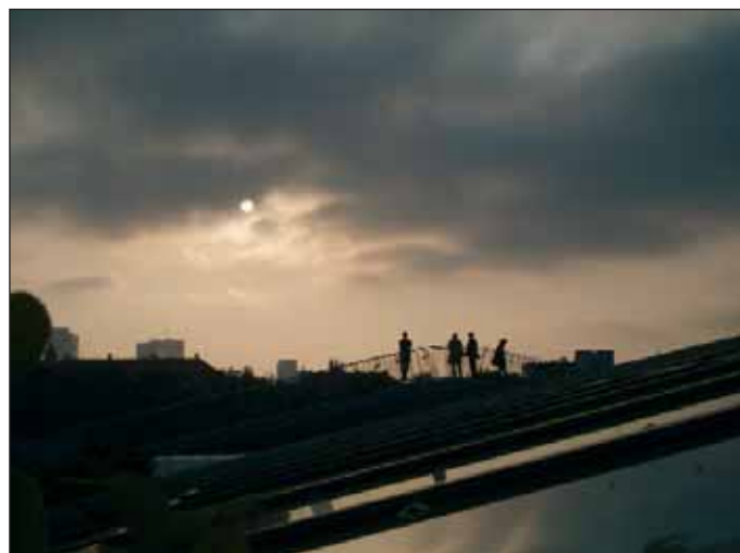
Panorama Warszawy widziana z ogrodu na dachu (Sierańska 2007)

szych i najpiękniejszych ogrodów dachowych w Europie. Ogród, będący integralną częścią całego systemu zieleni otaczającego budynek Biblioteki, o łącznej powierzchni ok. 17 000 m 2 ,