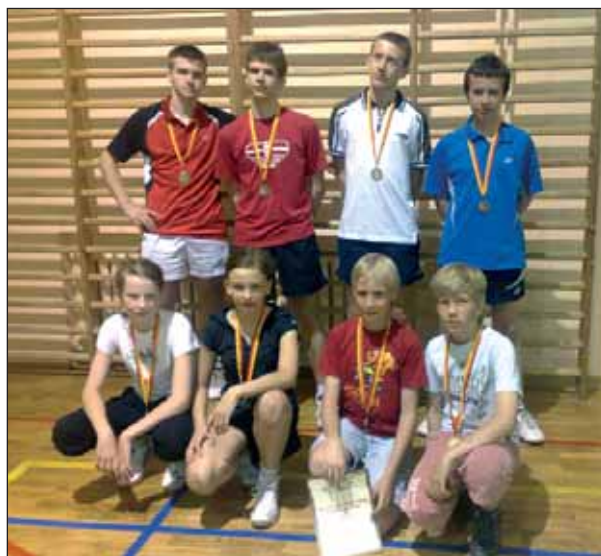
Na zdjęciu zadowoleni medaliści z Zielonej.