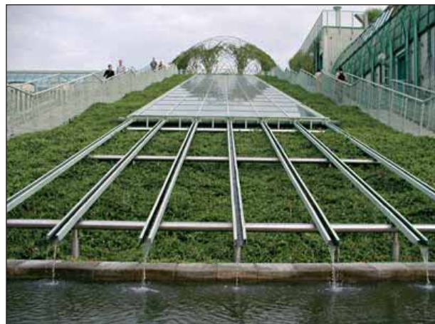
Wejście na dach Biblioteki Uniwersytetu Warszawskiego po pochylni obrośniętej barwinkiem i spływającą kaskadowo wodą (Sierańska 2007)

Właśnie tak możemy się poczuć odwiedzając ogród Biblioteki Uniwersytetu Warszawskiego. Zaprojektowany przez architekturę krajobrazu Irenę Bajerską w 2001 r. jest jednym z najwięk-