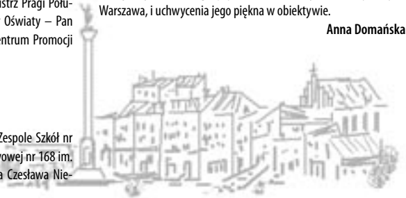
Rys. Adam Gościński