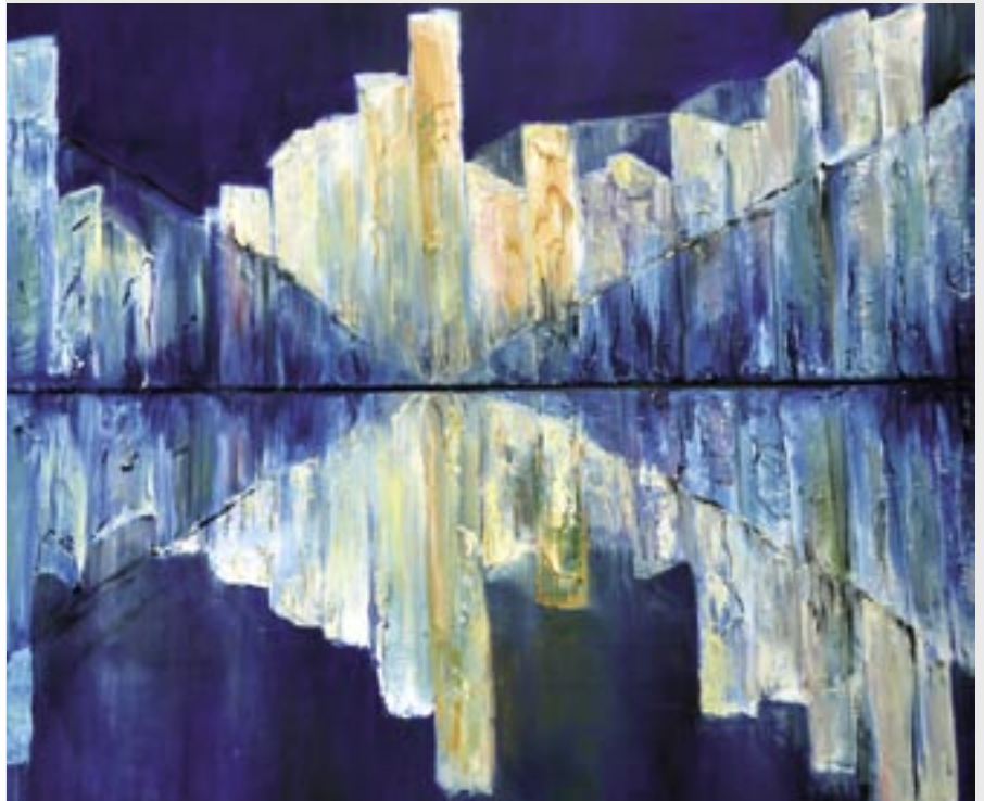
Druga część tryptyku – MIASTO ARTYSTÓW – olej – płótno 100x120cm. 2011r..