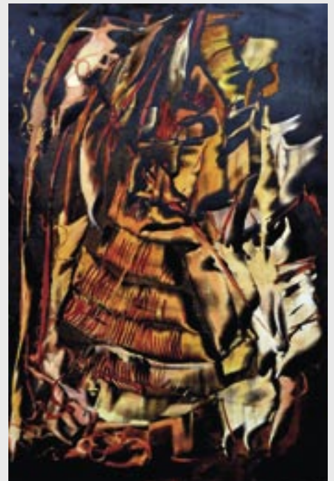
ŻAGLE – monotypia 52x35 – 2013 r.