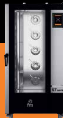
ST Gastro Big

gastronomiczne · piekarnicze · odpiekowe