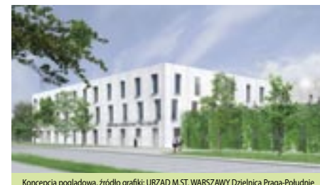
Koncepcja poglądowa

Przed wszystkim dzięki nowoczesnej wielofunkcyjnej scenie z widownią będą mogły wreszcie odbywać się na Goławiu wydarzenia artystyczne, które do tej pory omijały to prawie już 100-tysięczne osiedle. Swoje miejsce znajdzie tu biblioteka i szereg pomieszczeń wystawowych i pracy twórczej.