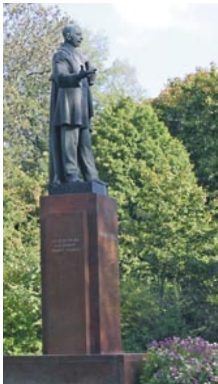
Pomnik Edwarda M. House'a w Parku Skaryszewskim.

W 1916 roku House poznał polskiego pianistę Ignacego Paderewskiego, który przyjechał do Ameryki ze swoją humanitarną misją dla Polski. W tym czasie przez ziemie polskie przechodził front działań wojennych, szerząc zniszczenia i głód. Ignacy Paderewski organizował pomoc, którą Amerykanie przesyłali do Europy. W tym czasie Stany Zjednoczone były jeszcze neutralne, a pomoc dla narodów dotkniętych wojną była niezwykle hojna. Społeczeństwo amerykańskie było przychylnie bardziej Polakom niż sprawie niepodległości Polski.