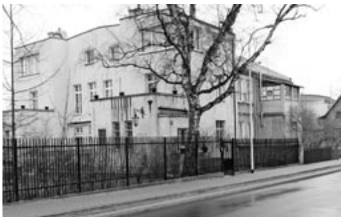
Dom rodzinny pułkownika na Grochowie – jeden z najcenniejszych obiektów Grochowa – wybudowany w 1934 r.