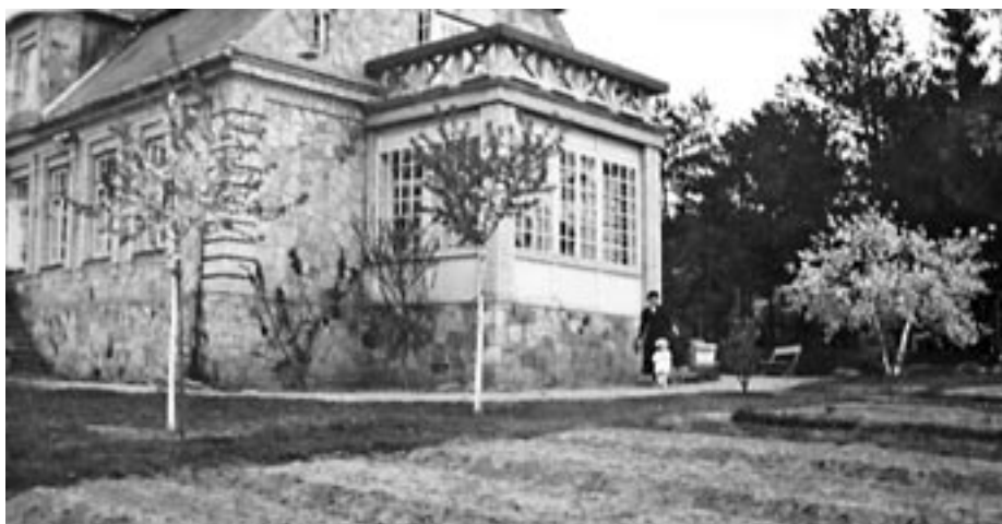
Tzw. biała willa w Dębnie

25 września oddział bojowy Szypowskiego maszerował w kierunku Zamościa, przyłączały się do niego grupy rozbitych oddziałów. Podczas marszu charakterystycznym dla Rostocza zбочem z rozległym jarem po przeciwnej stronie pojawiły się sylwetki grupy żołnierzy. Odnosząc wrażenie, iż to kolejne grupy polskich rozbitych oddziałów, zaczęło do nich przyjaźnie machać. Tymczasem