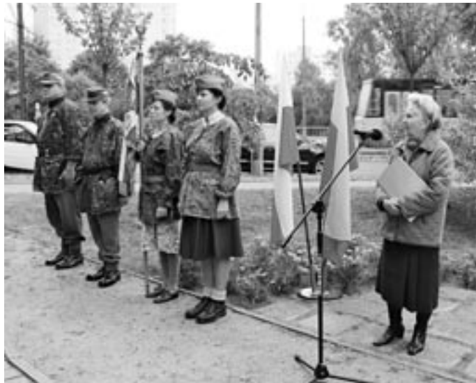
Tegoroczna uroczystość pod pomnikiem w grochowskim parku Leśnika

Pułkownik powrócił do kraju w 1945 roku i tak rozpoczął się trudny dla niego czas represji i szykanowania przez komunistyczne władze. Bogata biografia obfitująca w niezwykle bohaterskie, patriotyczne czyny i dokonania to jeden z ważnych rozdziałów historii Polski. Był zawsze w gotowości tam, gdzie trzeba było walczyć o Nią i Jej niepodległość.