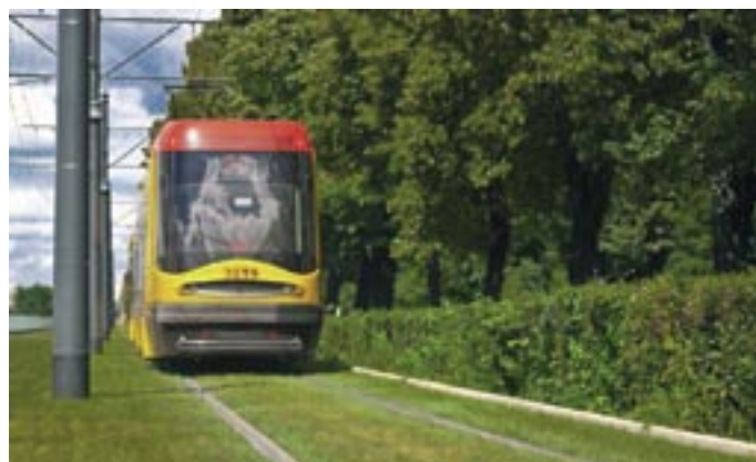
Oficjalne zdjęcia Tramwaj Warszawskich